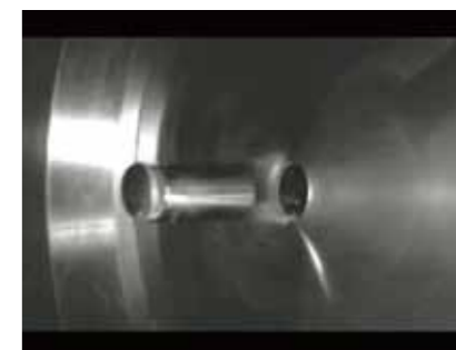
▲空気砲衝突試験(例:アルミ板貫通試験) 飛翔体寸法 φ10~φ120mm 最大能力 6000Nm 衝突速度 最大 500km/h (衝突物の形状と重量による)