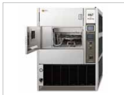
▲メタリングウェザーメーター 放射照度 0.80kw/m 2 ~2.50kw/m 2 (295nm~450nm) 有効照射面 440mm×180mm 温度範囲 30℃~85℃ 湿度範囲 30%RH~70%RH