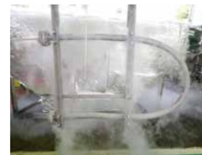
▲低温耐圧試験 試験温度 約-190℃ 浸漬液 液体窒素 加圧媒体 Heガス