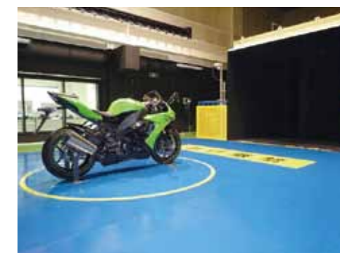
▲風洞試験 縮流胴出口寸法 3m (W) × 2.5m (H) 最大風速 50m/s 型式 回流式セミオープン型 測定部長さ 8m 中央に六分力天秤内蔵型 ターンテーブルを設置 ターンテーブル直径 φ 2.5m ホイールベース寸法 1160mm ~ 1960mm