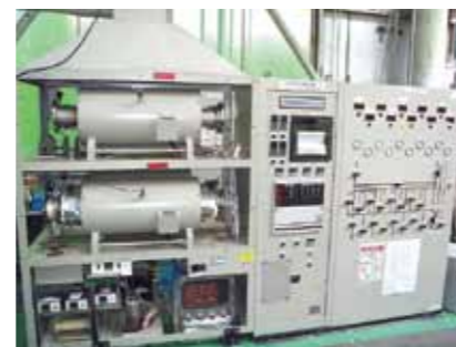
▲高温腐食試験装置 推奨試験片寸法 10mm×10mm×3.0mm t 最高温度 900℃ ガス種類 H 2 S、SO 2 、HClなど