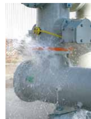
▲防水試験 準拠規格 JIS C 0920 (IP試験) NDS C 0110Eなど 大型試験体(1辺2m超)に対応