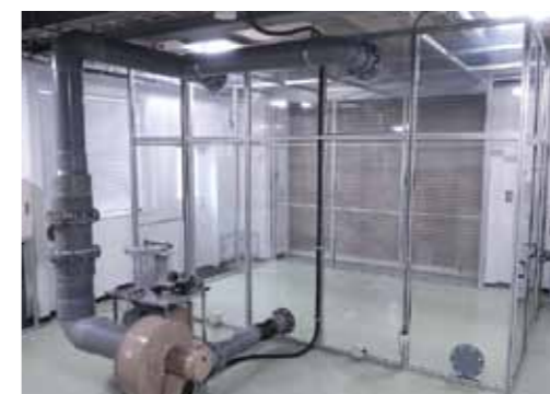
▲大型防じん試験室 試験室寸法 4.3m (W) × 3.0m (D) × 2.9m (H) 準拠規格 JIS C 0920 (IP試験)、 JIS E 4036、JIS D 0207など