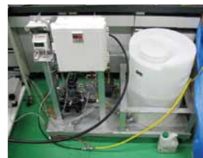
▲水圧サイクル試験装置 試験圧力 最大40MPa 昇圧時間 10あたり1秒~ 対象製品 機械部品、小型容器、継手など