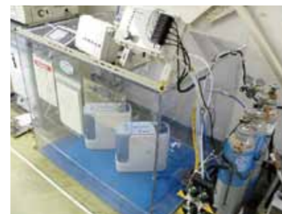
▲混合ガス腐食試験装置 内寸 1200mm×880mm×980mmH ガス種類 H 2 S、SO 2 、Cl 2 、NO 2 など 準拠規格 JIS C 60068-2-60他