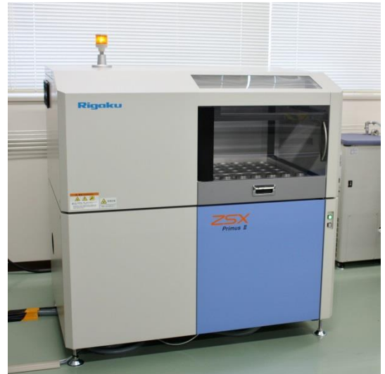
(株)リガク製 蛍光X線分光分析装置 ZSX PrimusII